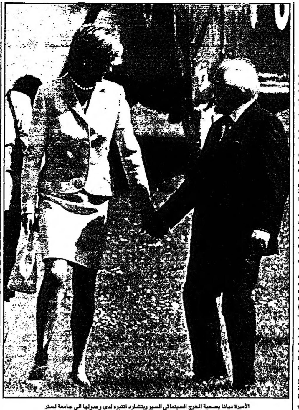
الأميرة ميانا بصحبة المخرج السينمائي السويدي ريتشارد ايفرت الذي وصلها الى جامعة لسر لحضور حفل اسس بمناسبة افتتاح مركز رعاية للمعوقين